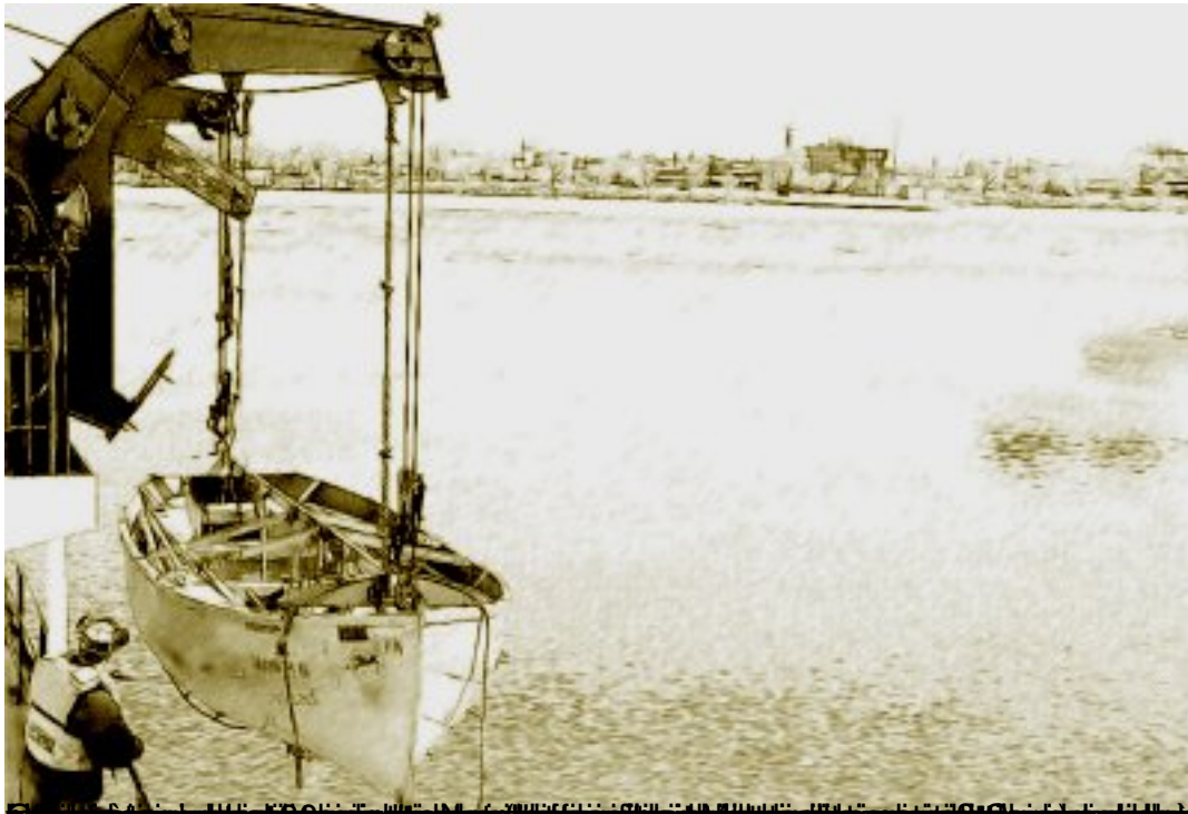
Boat being hoisted by crane in the port of Schegge, 1911