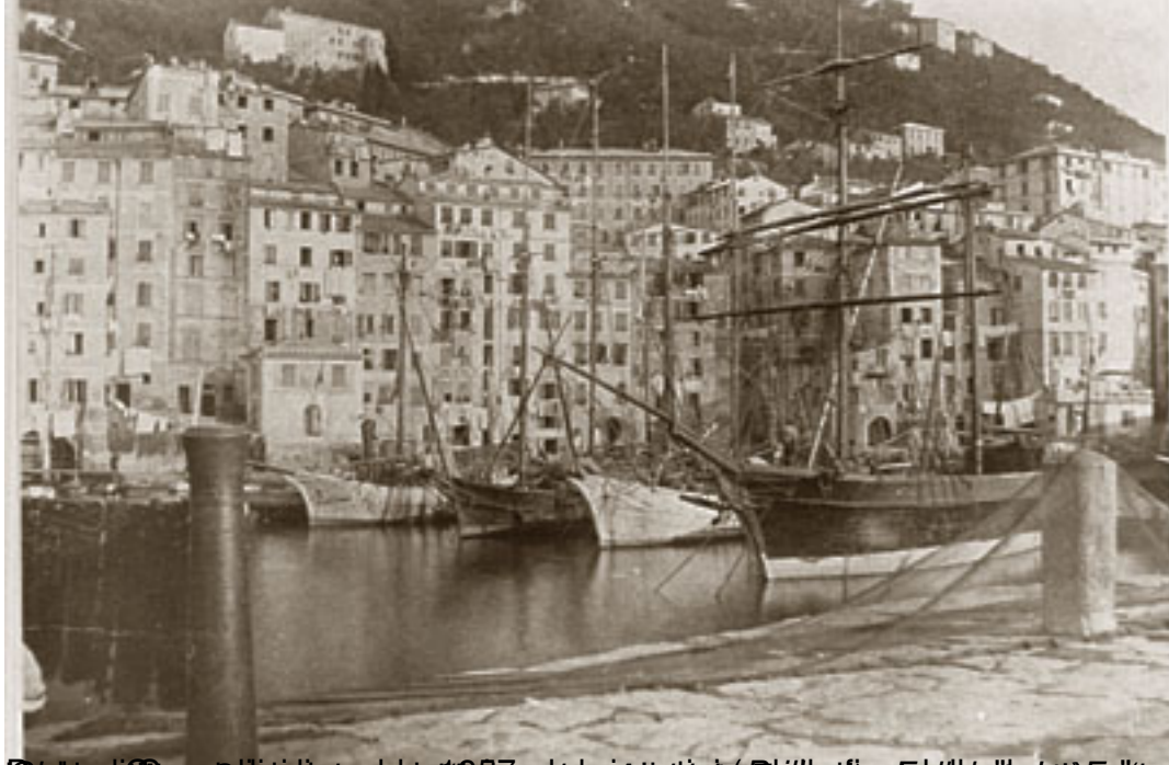
Boat in the harbor of Schegge, 1911