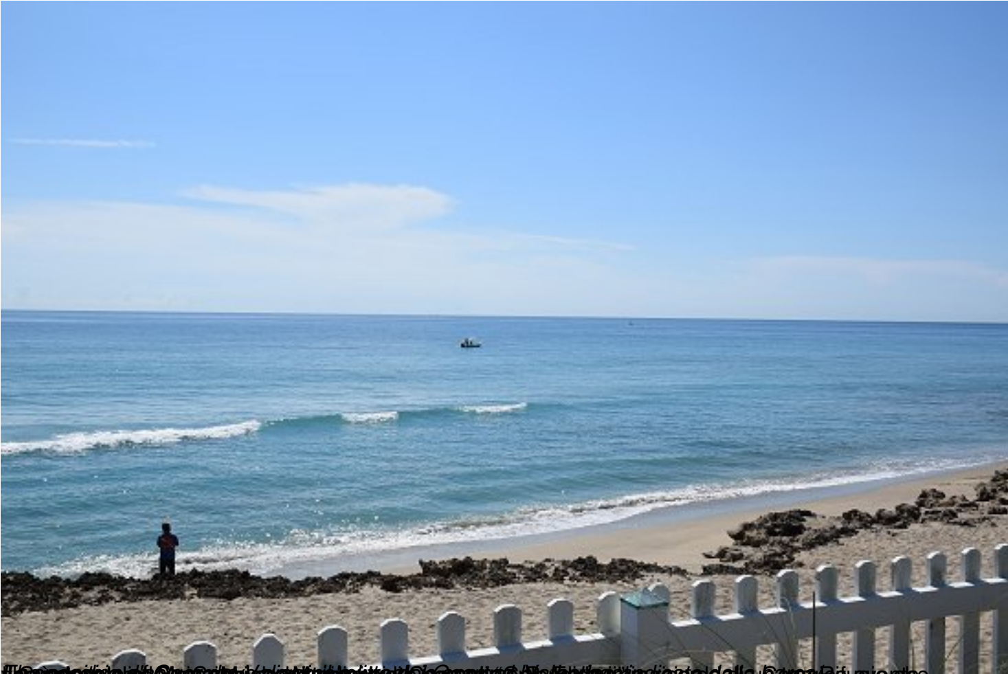
Una spiaggia di Camogli, in provincia di Genova, con un veliero camogliese in navigazione.